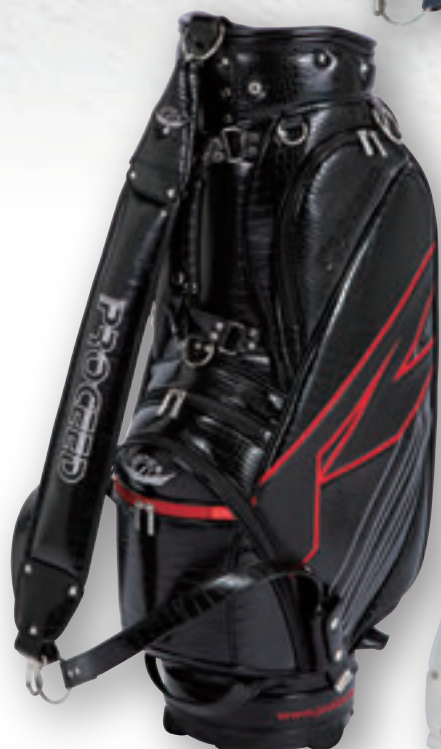
クロコ調 【ブラック】