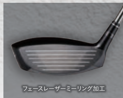
フェースレーザーミーリング加工