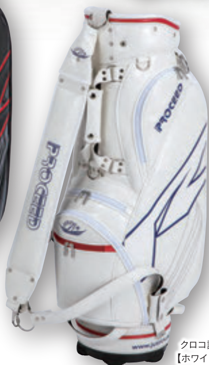
クロコ調 【ホワイト】