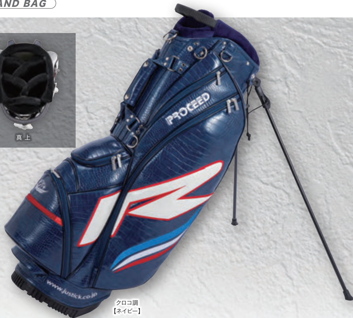
クロコ調 【ネイビー】