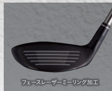
フェースレーザーミーリング加工