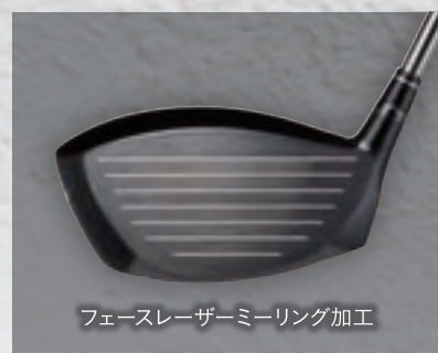
フェースレーザーミーリング加工