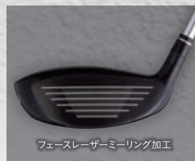
フェースレーザーミーリング加工