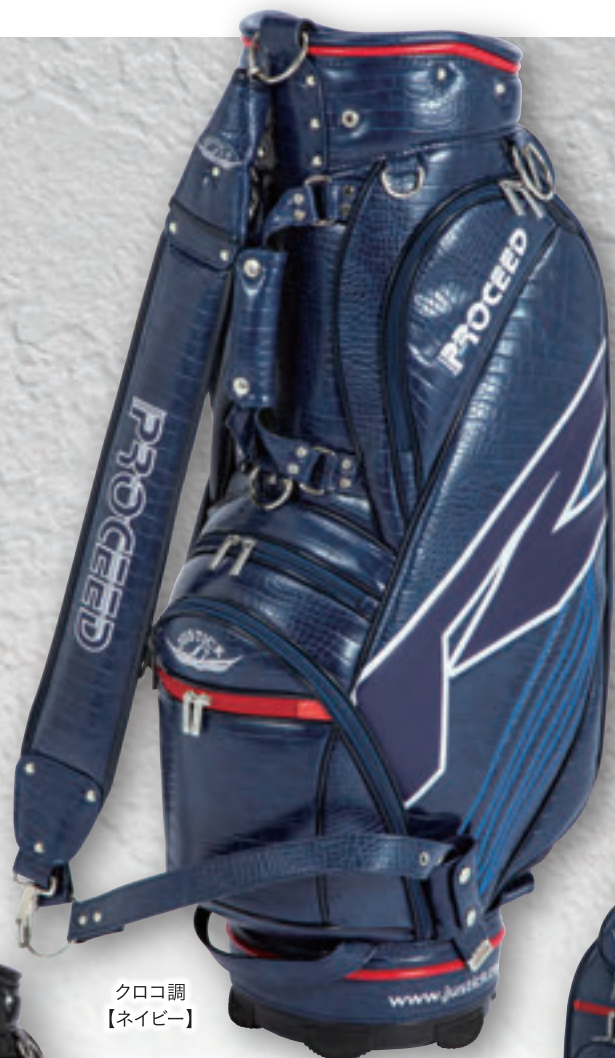
クロコ調 【ネイビー】