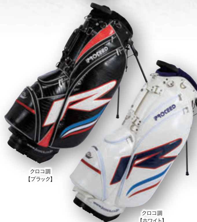
クロコ調 【ブラック】