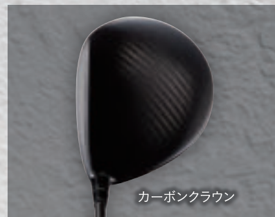
カーボンクラウン