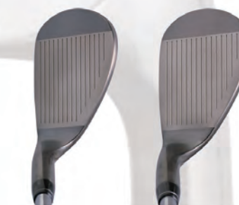
●ロフト52° ●ロフト58° ●フェイスWミーリング/USコアライン彫刻